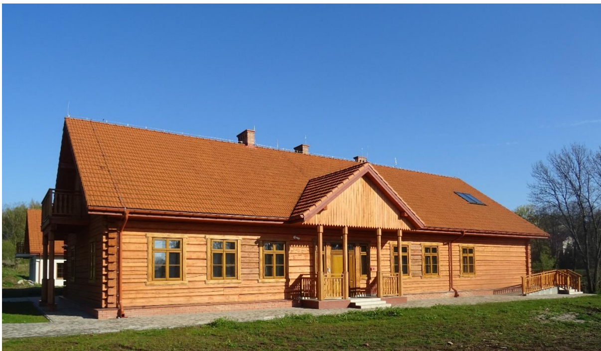
Rysunek 1 Część zabytkowa dworku.