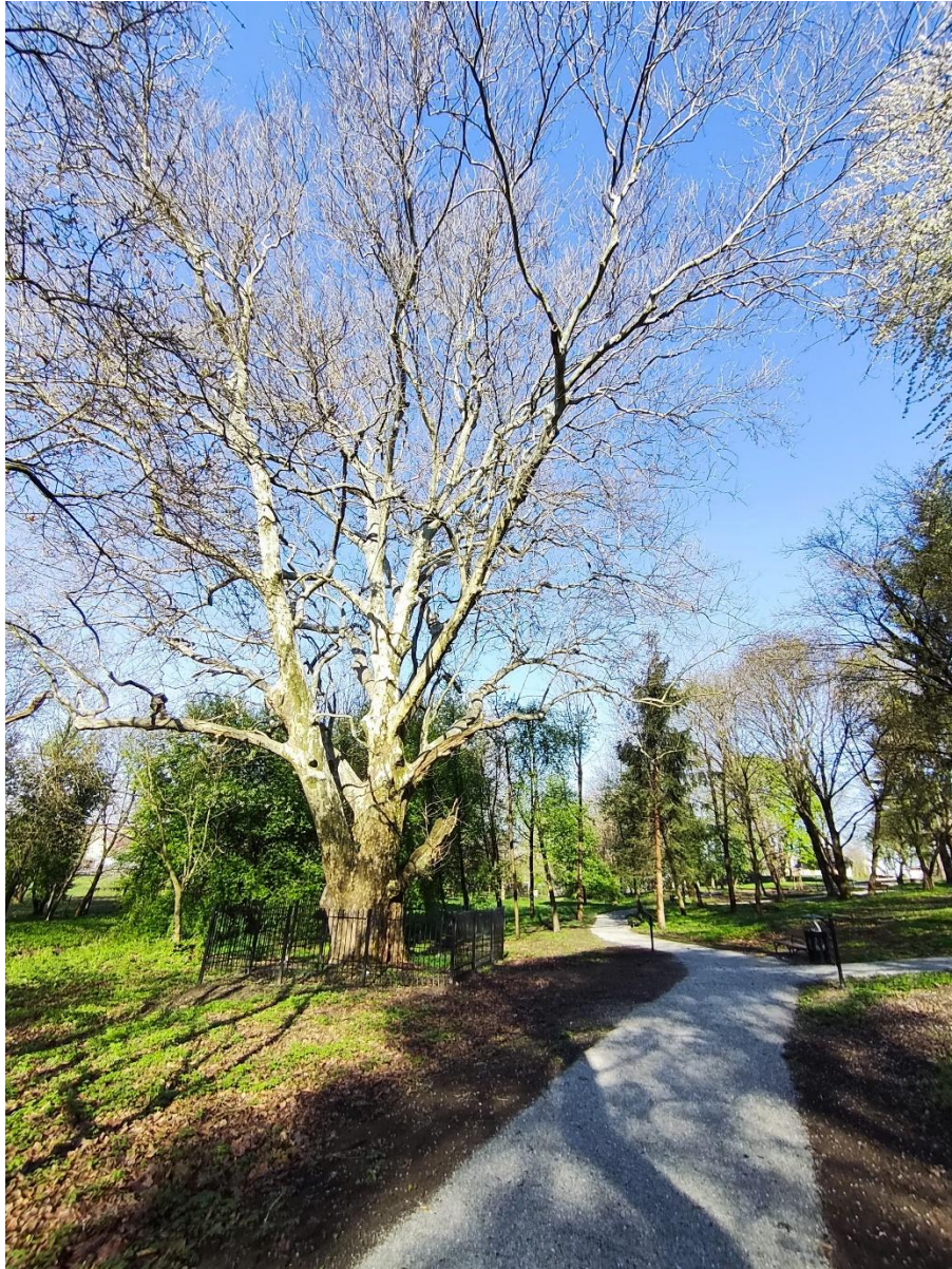
Rysunek 3 Aleja wraz z drzewem pomnikowym.