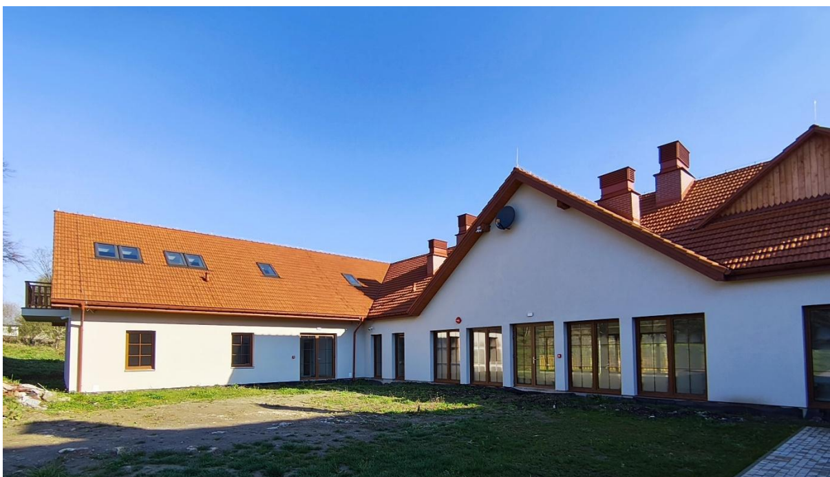
Rysunek 2 Nowa część budynku.